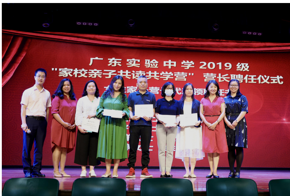
家长营长聘任仪式