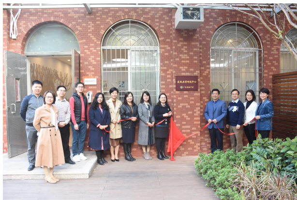
家校共育研究中心成立

我中心在 2020 年 12 月 10 日成立了家校共育研究中心，今后将在探索家校共育机制与实践的路上继续坚实地走下去。