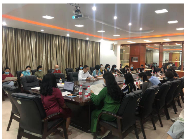
家长营长工作会议