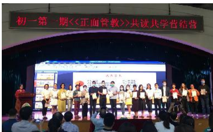
初一第一期《正面管教》共读共学营结营仪式