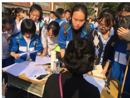
专·享——高校专业分享交流会现场