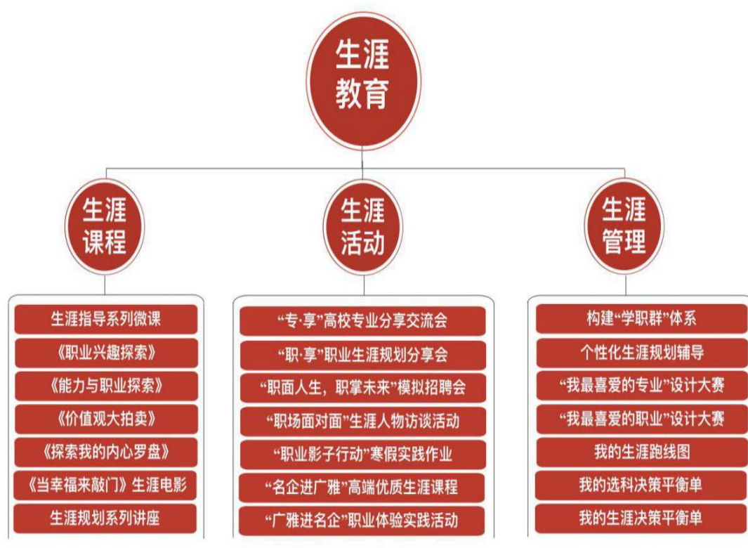
图 1 广雅中学生涯指导体系

其中，生涯规划指导是广雅中学生涯教育的特色及典范，我校以新高考改革为背景，建立了完善和系统的生涯规划指导体系，力求将生涯指导工作落实到每一位学生身上，为学生的成长赋能。我校生涯指导体系包括生涯课程、生涯活动和生涯管理三大方面（见图 1），其中生涯课程进课表，生涯活动和生涯管理全校学生齐参与，充分体现了课程育人、活动育人、实践育人和协同育人。接下来将以“广雅中学生涯指导体系”为我校典型案例来展开详细介绍。